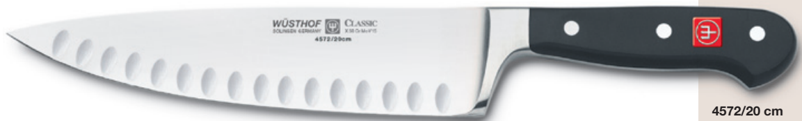
Abb. zur Veranschaulichung seitenverkehrt. Abstreifer und Ätzung auf rechter Seite. Picture reversed for illustration purposes. Ridge and etching are on the right side of the blade.

gelocht, mit Abstreifer with deflecting ridge