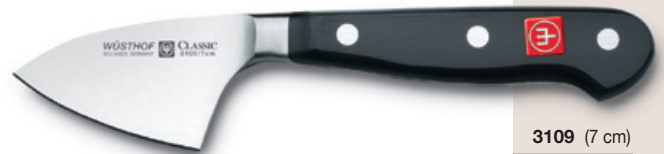
3109 (7 cm)

Käsemesser cheese knife couteau à fromage cuchillo para queso coltello formaggio