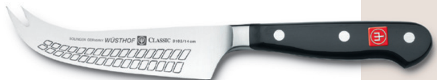
3103 (14 cm)