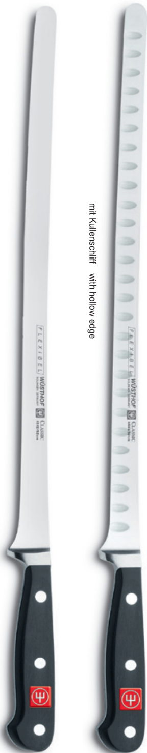
4542 (32 cm)

Lachsmesser salmon slicer couteau à saumon cuchillo para salmón coltello salmone