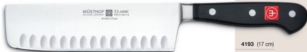
mit Kullenschliff with hollow edge