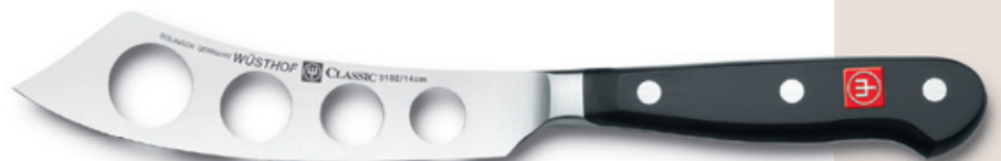
3102 (14 cm)